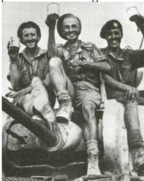
Британские танкисты после победы в Эль-Аламейне. 1942 г.

покинутые англичанами. 13 ноября он занял Тобрук, 20 — Бенгази. Решающий поворотный момент произошел в войне в Африке.