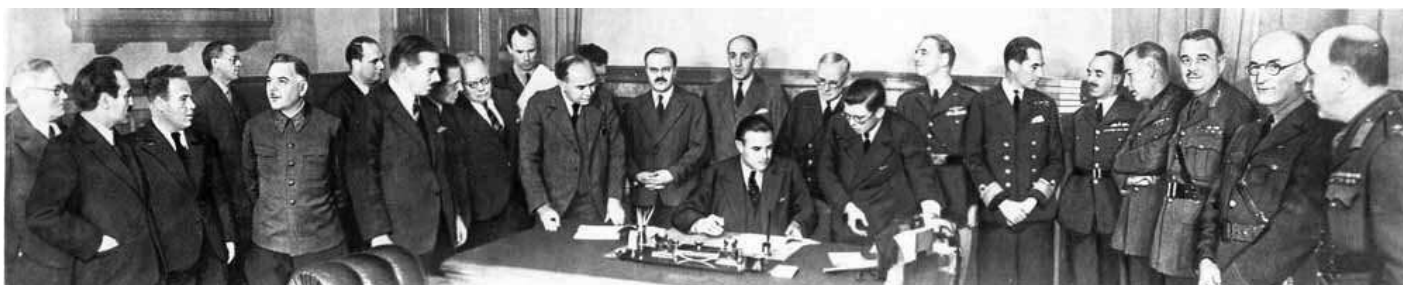
Московская конференция министров иностранных дел СССР, США и Великобритании 19–30 октября 1943 г.

В рамках договорённостей с союзниками в конце лета — начале осени 1941 г. СССР и Великобритания ввели войска на территорию Ирана. Цель операции заключалась в предотвращении перехода Ирана на сторону Германии, защите его нефтяных промыслов, а также в обеспечении коридора для поставок в СССР по ленд-лизу.