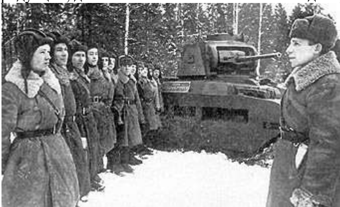
Советские танкисты и британский танк «Матильда»

В общем объём поставок по ленд-лизу оценивают в 10% от уровня советского производства за годы войны. Однако поставки по своему содержанию были не однородны. Отмечается огромное значение продовольственных поставок, так как сельское хозяйство нашей страны было разрушено. Развитая американская автомобильная промышленность поставила в СССР огромное количество грузовиков, которые практически перестали производиться в нашей стране в годы войны, поскольку промышленность была переориентирована на танкостроение. Схожая ситуация сложилась и в железнодорожной сфере: многие железнодорожные предприятия перешли на производство военной продукции, даже послевоенные танковые заводы продолжали носить имя вагоноремонтных.