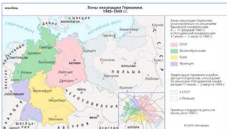
Зоны оккупации Германии (1945—1949). Автор 52 Pickur

На конференции было решено ликвидировать в Германии всю военную промышленность (демилитаризация) и нацистские организации (денацификация), а также переустроить политическую сферу под будущее (демократизация) и передать управленческие и экономические функции на средний и нижний уровни (децентрализация). Эти меры должны были исключить возможность Германии в будущем вернуться к нацизму и создать мощную военную экономику.