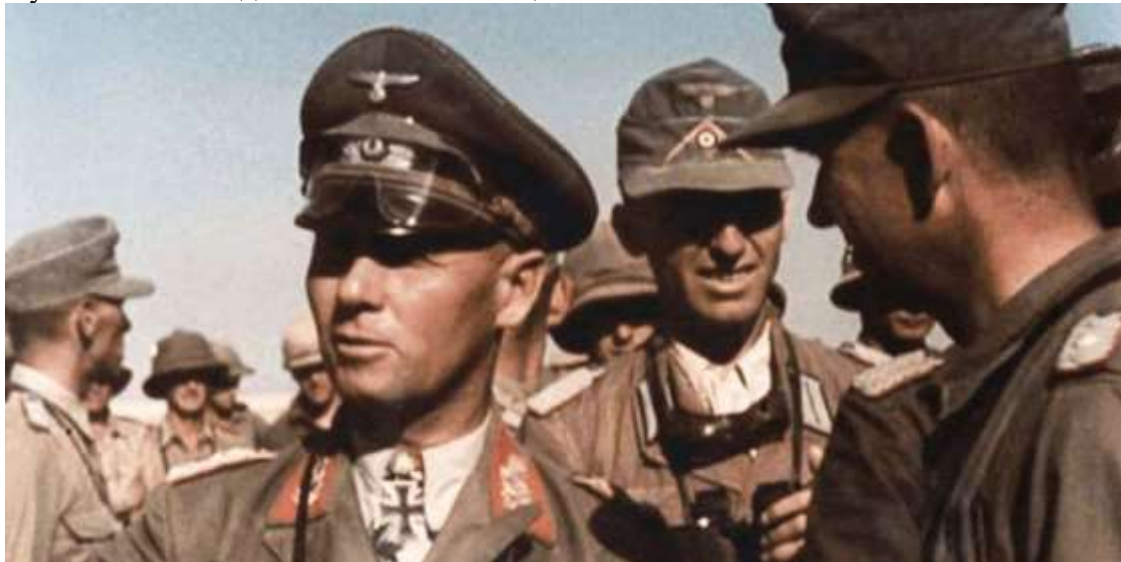
Генерал-лейтенант Эрвин Роммель в Ливии, 1942 год

А потом англичане остановились: им еще нужно было отправить войска в Грецию. Пришла очередь итальянцев использовать сберегательное перемирие и воспользоваться опцией «позвонить другу». В отличие от балканских приключений Муссолини, Гитлер считал свои планы в Северной Африке вполне разумными и немедленно оказал помощь.