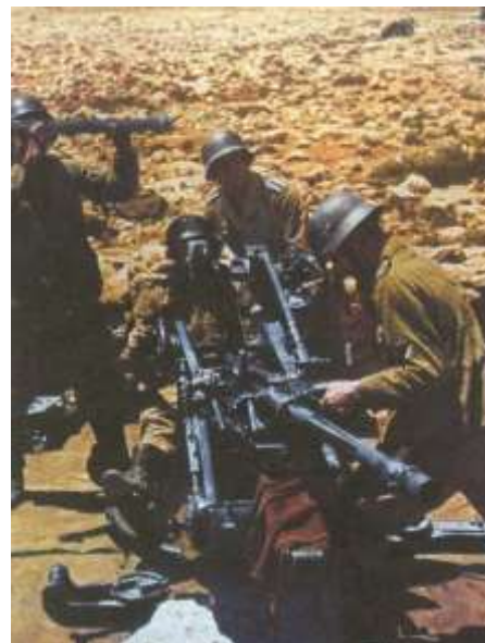
Немецкие зенитчики готовятся к отражению атаки британской авиации. 1941-1942 гг

Передвигаться по пустыне можно было только на автомобилях или бронетранспортерах. Эти особенности предопределили своеобразие театра военных действий в Северной Африке, его отличие от других, на которых проходили сражения Второй мировой войны. Здесь велись вооруженные бои небольших моторизованных отрядов, которые гнались друг за другом вдоль морского побережья и отдыхали между стычками (а также для снабжения себя водой) в оазисах-поселениях, расположенных за много километров. При этом местное (арабское) население практически не пострадало, так как представители обеих противоборствующих сторон относились к нему с презрением, в колониальном духе, понимая, что разорение некоторых поселений не соответствует их интересам.