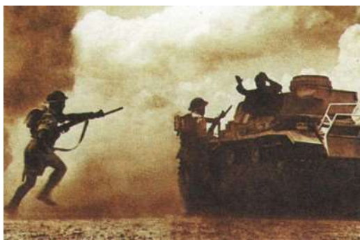
Захват итальянского танка в ливийской пустыне. 1941 гр.